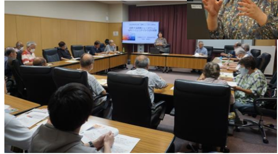
各市行政改革市民会議 審議会委員、神戸 新審議会委員